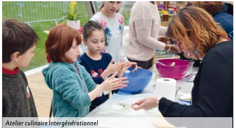
Atelier culinaire intergénérationnel