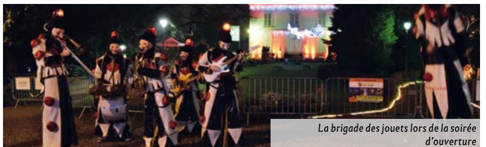
La brigade des jouets lors de la soirée d'ouverture