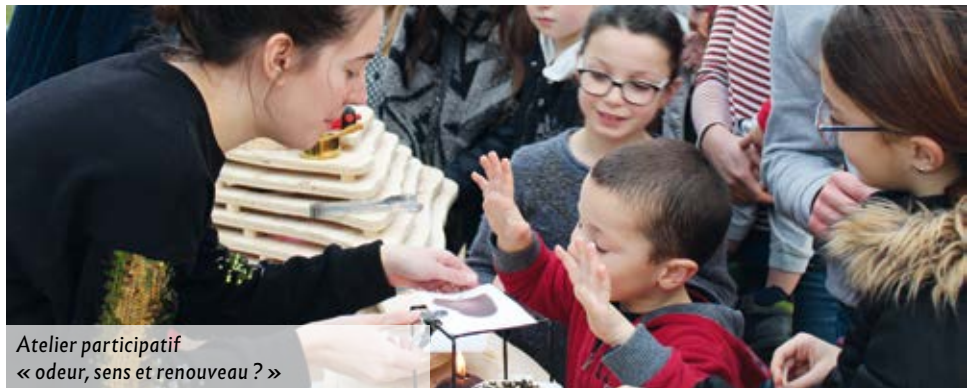
Atelier participatif « odeur, sens et renouveau ? »