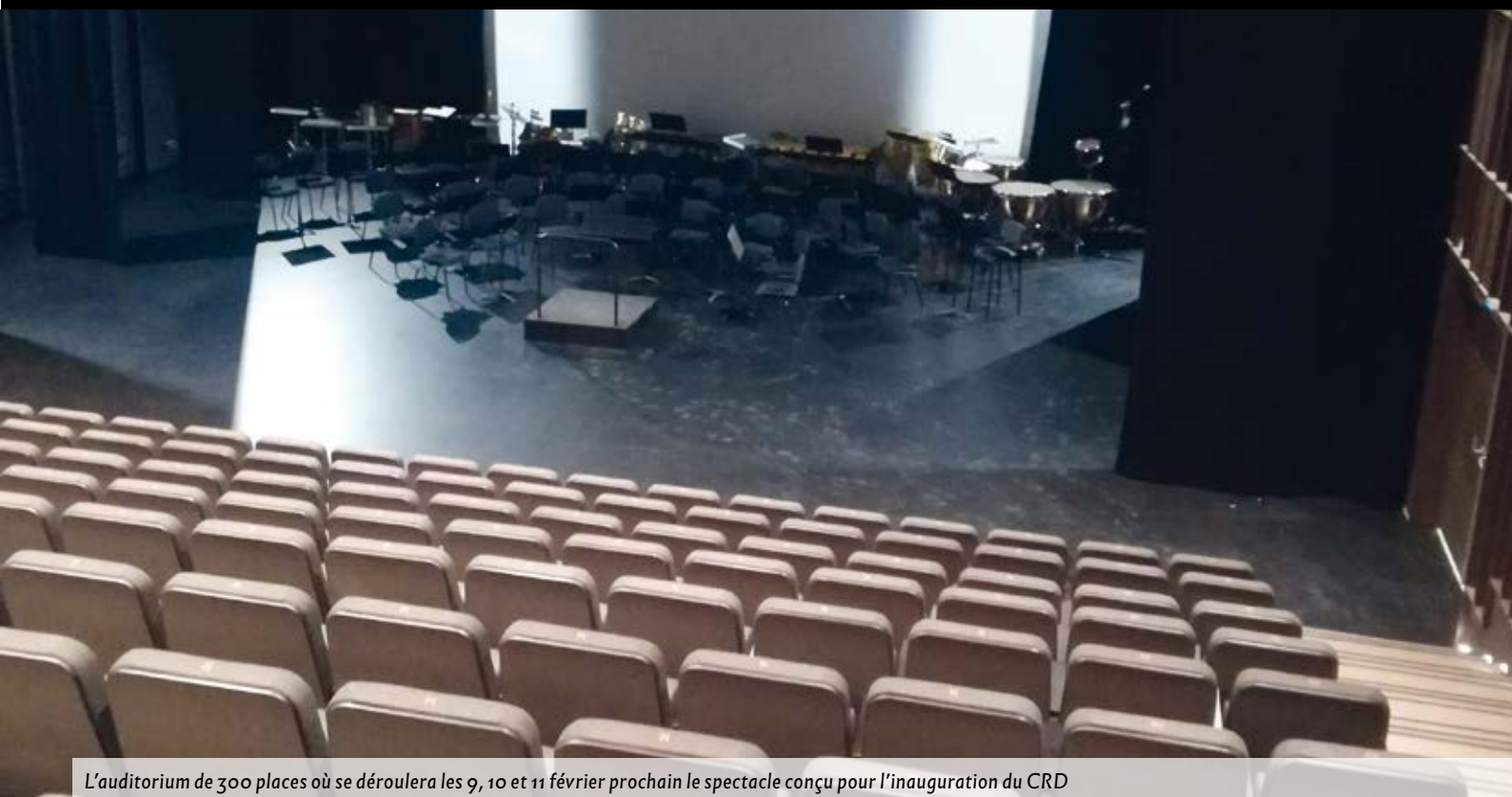
L'auditorium de 300 places où se déroulera les 9, 10 et 11 février prochain le spectacle conçu pour l'inauguration du CRD