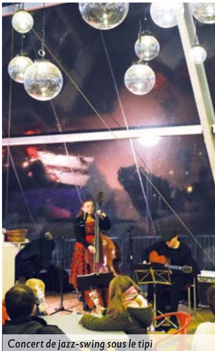
Concert de jazz-swing sous le tipi